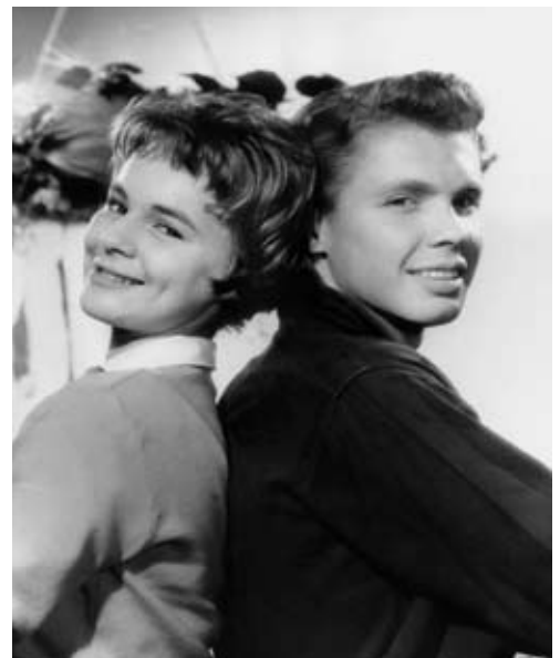
Teenager-Idole der 50er und 60er Jahre: Conny Froboess und Peter Kraus

In der Woche vom 13. bis zum 18. April startet euromaxx mit den 50er Jahren: Mit Bildern von Petticoat bis Goggomobil entsteht das abwechslungsreiche Panorama eines bewegten Jahrzehnts.